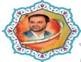
طرح شهید کاظمی آشتیانی